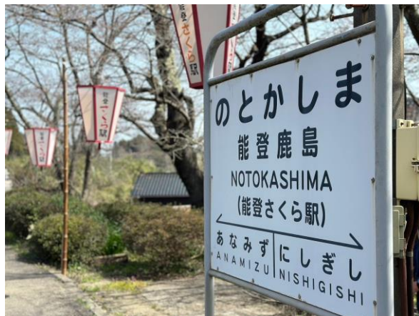
▲2024年 能登鹿島駅の様子

〈能登さくら駅の桜情報※〉 開花 4月9日 満開 4月14日 ※ウェザーニュース 能登さくら駅の花見・桜情報 https://weathernews.jp/sakura/spot/263/