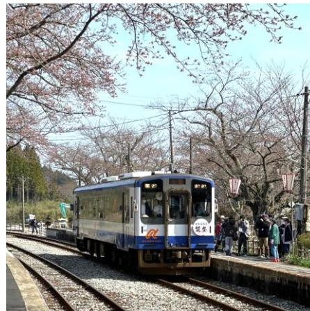
▲お届けするダンボールのイメージ、2024年 能登鹿島駅の様子