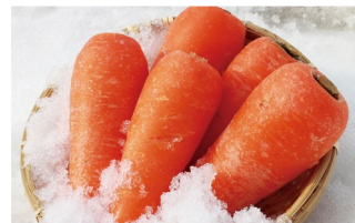
△らでいっしゅぼーや 雪下にんじん イメージ 4/7～12でお届け予定

らでいっしゅぼーやでは、今後も、制覇シリーズのラインナップを拡充し、お客様が果物や野菜の味の違いを発見し、食卓に喜びや驚きや笑顔が広がるようなサービスを提供してまいります。