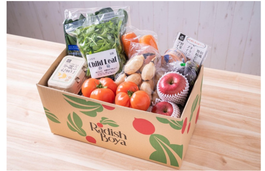
▲ふぞろいおためしセットの一例