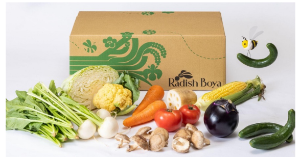
▲「めぐる野菜箱」イメージ写真（一例） ※お届けの地域によっては内容は異なります

https://www.radishbo-ya.co.jp/brand/meguru/