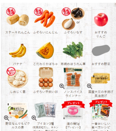
▲ふぞろいおためしセットの一例 届く食材は季節に応じて変わります