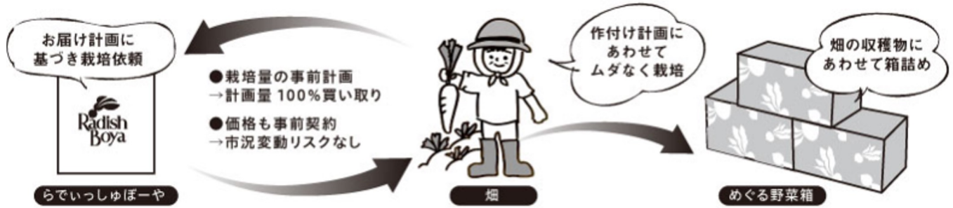
▲「めぐる野菜箱」お届けまでの仕組み

おためしセットだけでなく、定期会員になると利用できる産地も家庭もうれしい「めぐる野菜箱」は、収穫量が安定しない青果を、持続可能な形で販売するためのサービスです。らでいっしゅぼーやが実施している契約栽培は、事前に生産者と価格と出荷量を取り決めるため、生産者にとって安定した収入が確保できるというメリットがあります。また、旬の青果を、季節ごとの需要量と供給状況に合わせて箱詰めするため、豊作・不作時にかかわらず、種類・頻度・分量を調整することができ、当社と生産者との安定的かつ継続的な取引を実現しています。またお客様にとっては、野菜高騰の状況においても、一定した価格でのお届けが可能になります。また、「めぐる野菜箱」のオプションサービス「畑応援プラスコース」では、契約外の豊作品や規格外に育ってしまった青果を取り扱い、フードロスの削減にも寄与します。