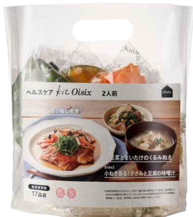
▲ヘルスケアKit Oisix 商品パッケージ

「がん患者さんをつくったヘルスケアOisix」では、『安心・安全な食材宅配』『医学的な知見を参考』『がん患者さんの生活に寄り添う』をコンセプトにしたミールキット「ヘルスケアKit Oisix」を展開。国内外のガイドラインや基準を参考に独自の要件を設定した4つのシリーズ（「バランスKit」「塩分3g以下Kit」「1日分の野菜Kit」「高たんぱく質Kit」）を提供しています。また2024年6月からは、「体調や都合に合わせて保存の効く商品が欲しい」というお客様からの声に応じて、「ヘルスケアKit Oisix（冷凍）」も販売しており、今後も今後もお客様のニーズを汲み、よりよい商品づくりに努めてまいります。