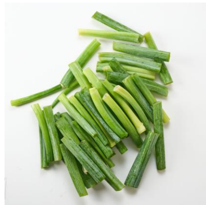
▲「用途いろいろ ねぎの青いところ ねぎっぼ」

このたびの長ねぎの供給不足を受け、この青い部分だけを集めて大容量規格・お求めやすい価格で販売を開始。鍋メニューやラーメン、炒めもののかさまし、刻んで卵焼きやお味噌汁、薬味などにたっぷりお使いください。