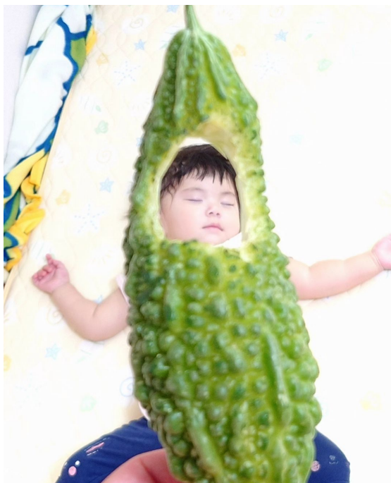
△おいしそうな#やさいドレスで賞 (@yuko_k11.17 さん)