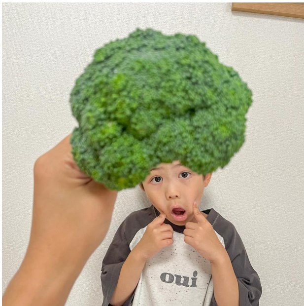
△カッコいい#やさいドレスで賞 (@pote_pote_tetete さん)