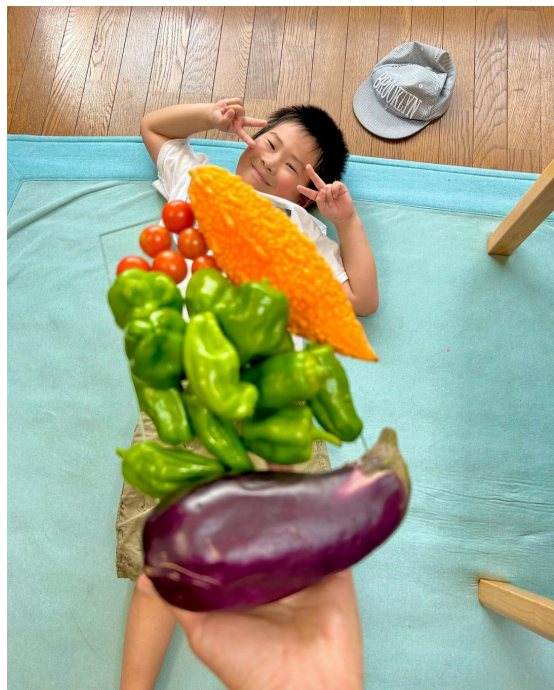
△#やさいドレス がシズってますで賞 (@kazumitsumama さん)