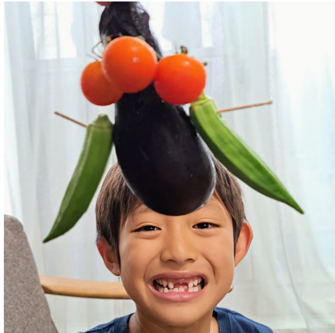
△ナイスヘアーな#やさいドレスで賞 (@salad626 さん)