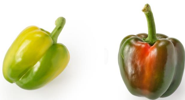
▲カメレオンパプリカ

URL： https://www.oisix.com/sc/otasukeoisix