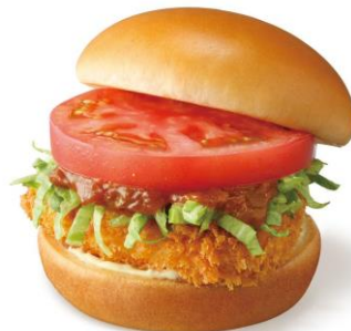
▲モスバーガー「ホットチキンバーガー」

本商品では「ホットチキンバーガー」ならではの爽やかな辛さのトマトソースをイメージして、ホットソースをごはんにも合うようにアレンジ。さらにレモンマヨソースで爽やかな風味も加えています。カリッと香ばしい鶏むね肉のフライとみずみずしい野菜にからめて、初夏の暑さに疲れた身体にも食欲そそるメニューに仕上げました。また、ごはんメニューとしての相性を考えて、香味野菜の旨味たっぷりのイタリアの万能調味料「ソフリット」を使ったごはんを合わせています。ホットソースは辛さが調整できるので、お子さまも含め家族全員で楽しめます。