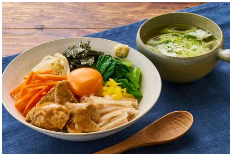
▲Kit Oisix「まぐろコンフィと夏野菜のシチリア風パスタ」(左)、「5種野菜とまぐろの胡麻だれ和風ビビンバ」