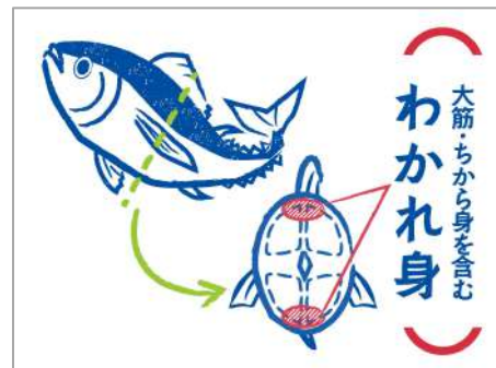
▲まぐろの「わかれ身」部分

Oisixではこの「わかれ身」を低温のオイルでじっくり旨みを余さず加熱する「コンフィ」とすることで、Kit Oisixメニューのメイン食材にアップサイクルしています。今後も第2弾商品「まぐろコンフィとたっぷり野菜の和風ビビンバ」を7月に販売するほか、Kit Oisix以外の加工品の開発も進めてまいります。