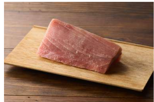
▲まぐろの「わかれ身」(生)