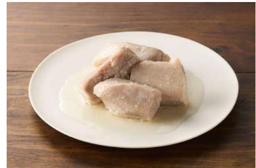
▲「わかれ身」のコンフィ