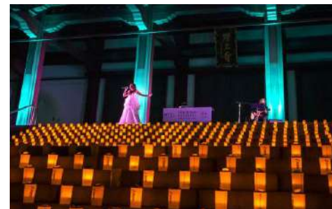
▲ミニライブの様子（2023年開催時）