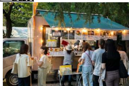
▶もったいナイキッチンカー（2023年開催時の様子）

大地を守る会からは、大地を守る会で扱う有機栽培をはじめ環境に配慮した食材を販売するマルシェと、もったいナイキッチンカーが出演。もったいナイキッチンカーでは、フードロス食材を有効活用した当日限定の野菜スープを提供します。また大地を守る会の野菜をつかったサンドイッチなどを用意。さらにクラフトビールやオーガニックワインも提供します。