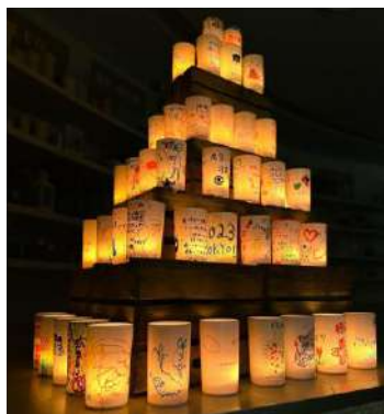
▲メッセージキャンドルツリー イメージ