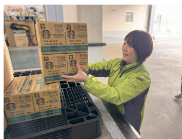
▲前橋市と板橋区の食材引き取り風景(写真 左:前橋市・右:板橋区)