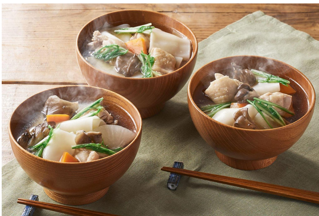
▲Kit Oisix「もちもちつるん！はっと汁」

URL： https://oisix.com/sc/gotochi_gourmet