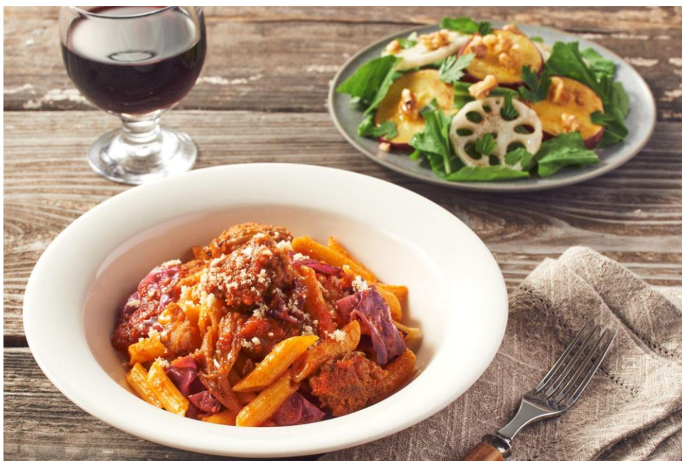
▲Kit Oisix「サルシッチャと赤キャベツのペンネ」

URL： https://www.oisix.com/sc/dean&deluca