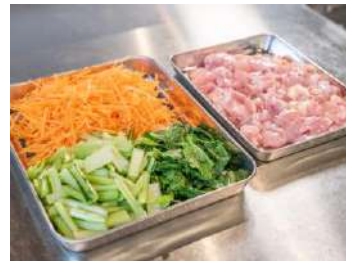
▲「給食用手作りミールキット」一例

この度のブランド刷新では、「Oisix」ブランドの認知度や信頼度を活かし、栄養士を中心に給食に関わる全ての人と一緒に作ることをイメージした積み木をモチーフに、ロゴマークを開発しました。