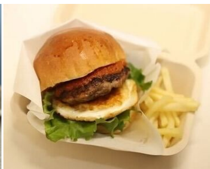
▲「山形村短角牛」を使ったハンバーガーなどをキッチンカーで販売

<LiLiCoさんも来場！消灯をカウントダウン、キャンドルナイトトークステージ>