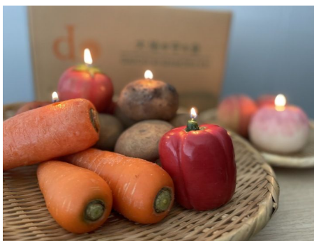
▲青果を模したキャンドルも会場に登場