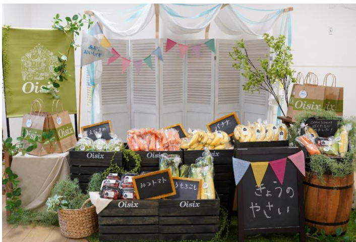
▲「Oisix こどもマルシェ」イメージ

ご来場のタイミングによってはご参加やプレゼントが難しい場合がありますのでご了承ください。