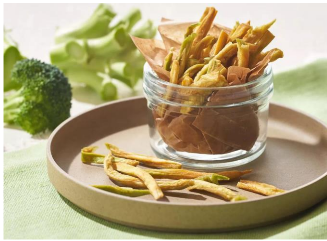
▲「Upcycle by Oisix」の商品例 写真は「ブロッコリーの茎チップス」