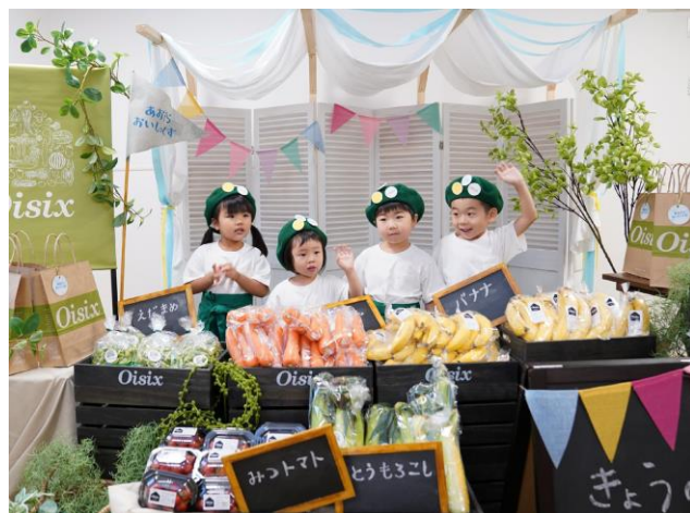
▲写真は“Oisix こどもマルシェ”イメージ

「おいしく楽しくサステナブル」をテーマに、こどもと一緒に楽しく学べる時間を提供します。