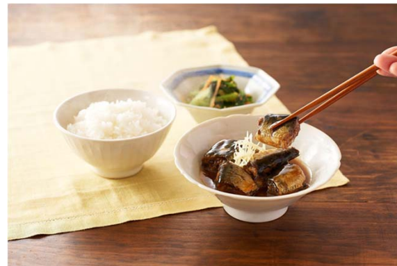
▲骨までまるごと！浅炊きいわし