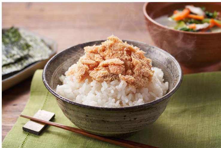
▲ごはんすすむ！北海道産焼き鮭たらこ和え 日々の食事作りで、昨年よりも値上げを感じる食品は？