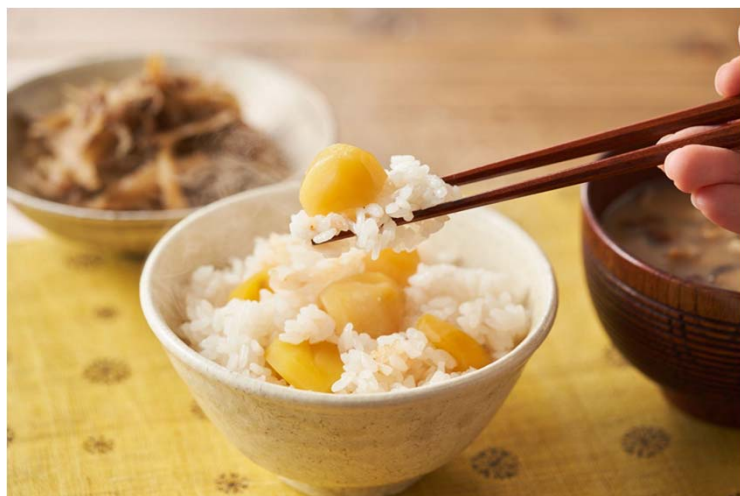
▲【無漂白】だし香るゴロっと栗ごはんの素

小麦を中心に食品価格の高騰が相次ぐ中、当社が実施したアンケートでは「今年4月以降お米を食べる機会が増えた」という回答が7割を超える結果となっており、価格が据え置かれているお米回帰が進んでいます。