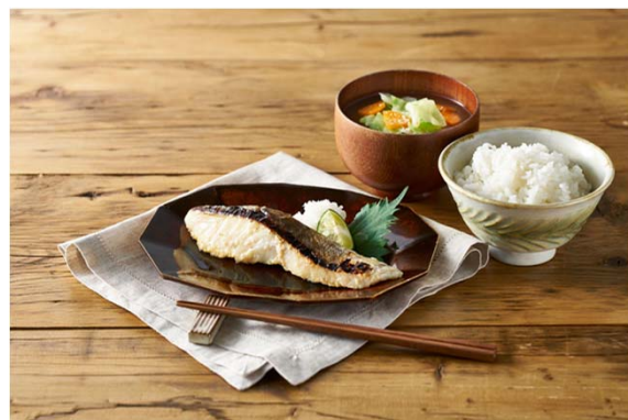
▲北海道根室産真鱈塩麹漬け

当社は、「サステナブルリテール」（持続可能型小売業）として、サブスクリプションモデルによる受注予測や、ふぞろい品の積極活用、家庭での食品廃棄が削減できるミールキットなどを通じ、畑から食卓まで、サプライチェーン全体でフードロスゼロを目指しています。