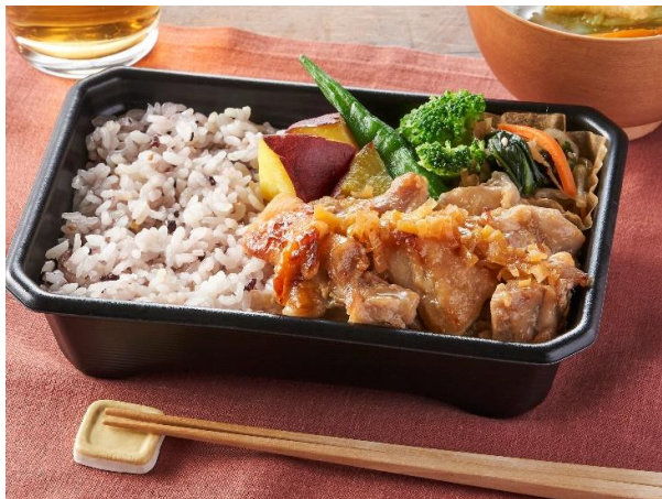
▲大戸屋 醤油麹チキンの香味ねぎ