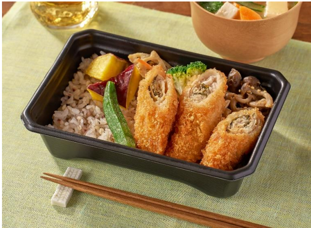
▲大戸屋 梅しそ巻きカツ弁当