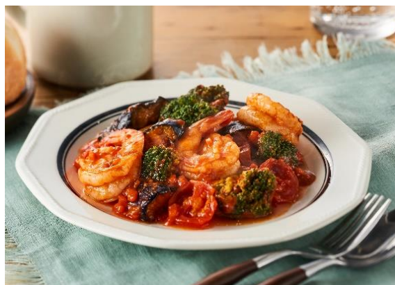
▲海老野菜のガーリックトマト