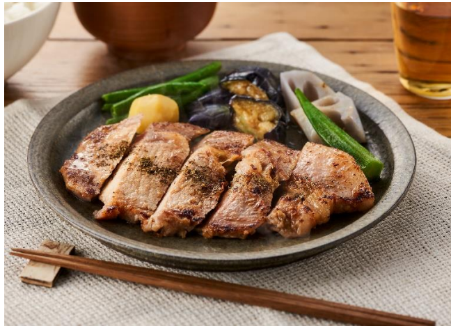
▲山椒香る 味噌漬け豚のソテー