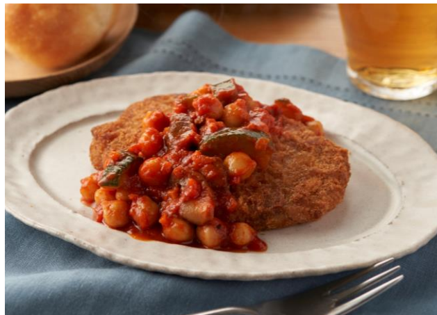
▲かつとゴロゴロ野菜トマトソース