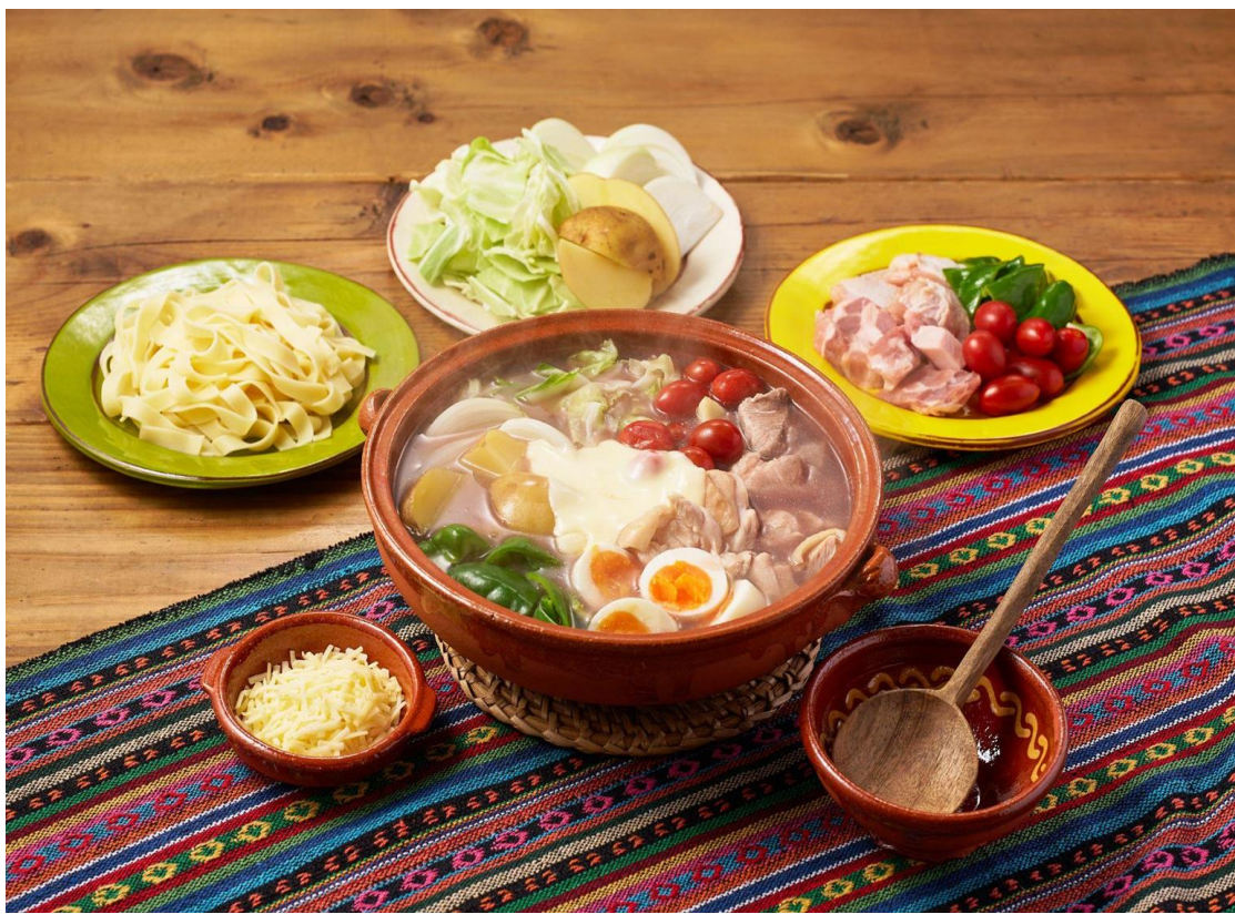
▲「こっくり豆の旨味広がる！メキシカンチーズ鍋」

販売ページURL： https://www.oisix.com/nabehanpukai2022