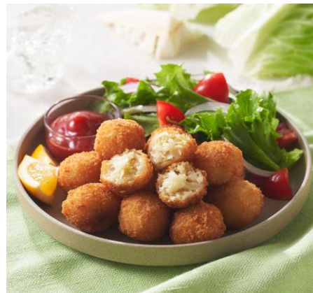
▲左より「皮までおいしく キャロットプチボール」「皮までおいしく れんこんプチボール」「芯までおいしく キャベツプチボール」