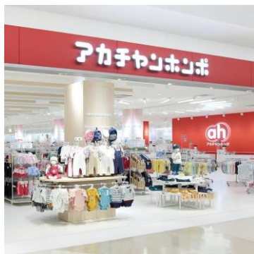
▲店頭イベントでサービスを紹介