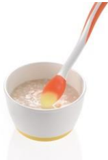
▲アカチャンホンポ オリジナル商品