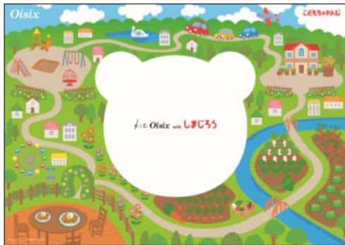
▲ランチョンマット