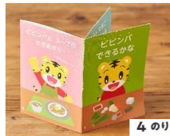
◀商品に付属する「オノマトペミニ絵本」

さらに、本商品は0～6歳を対象としており、お子様の月齢に合わせた「離乳食とりわけレシピ」もご紹介しているため、離乳食のみを別で作る手間が省け、料理のご負担軽減にも繋がります。