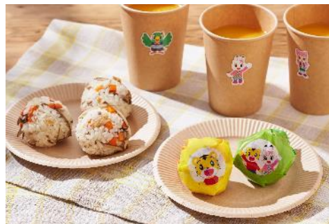
▲おうちピクニック（イメージ）