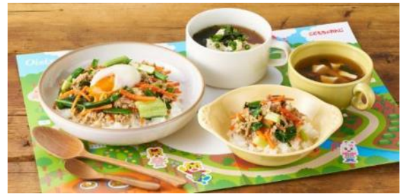
▲「Kit Oisix with しまじろう」商品画像