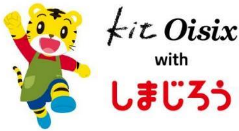
▲こどもちゃれんじキャラクター「しまじろう」と「Kit Oisix with しまじろう」ロゴ

商品販売ページURL： https://www.oisix.com/sc/kitwithshimajiro （Oisix定期会員でない方向け）