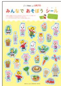
▲みんなであそぼうシール