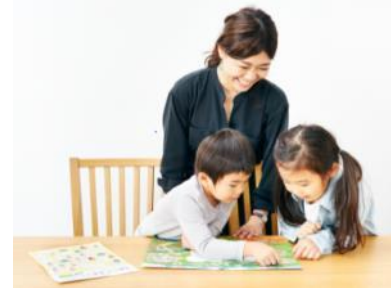
▲親子で商品を利用する様子

安心安全な食品をお届けする「Oisix」と、お子さまの年齢に合わせて発達・発育をサポートする「こどもちゃれんじ」は、このような状況下で“食”を通してお子様とコミュニケーションを取ることができ、また楽しい時間を過ごすことのできる商品をお届けしたいという点で両社の考えが一致し、今回の共同開発が実現しました。